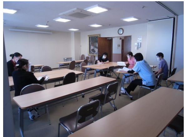
実地指導者会議風景