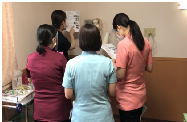
吸引についての講義中

5月・6月は4月と比較し、患者さんへの侵襲がある看護技術について研修を行いました。より患者さんの安心・安全・安楽に繋がる援助ができるよう、頑張っていきたいと思います！ 研修お疲れ様でした^^