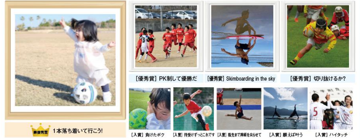
【優秀賞】PK制して優勝だ 【優秀賞】 Skimboarding in the sky 【優秀賞】 切り抜けるか? 【入賞】 負けたボク 【入賞】 待受けずっとこれです 【入賞】 指先まで神経を尖らせて 【入賞】 願えば叶う 【入賞】 ハイタッチ 【最優秀賞】 1本落ち着いて行こう!

今年度は、各種スポーツ大会やイベントの開催が少しずつ開催され始め、スポーツ界も活気を取り戻しつつありますね!今年もまたスポーツの魅力みなさんと共有できればという思いから「Instagram スポーツフォトコンテスト」を開催いたしました。「スポーツ最高!」をテーマに、応募のあった作品を当協会広報委員が審査いたしました。すべての作品は当協会ホームページからご覧いただけます。